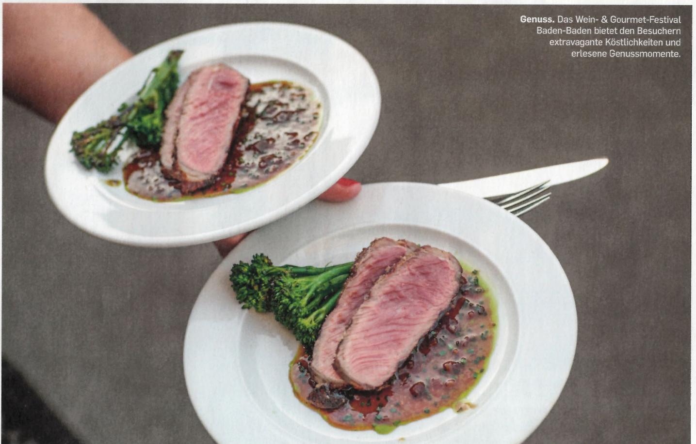
Genuss. Das Wein- & Gourmet-Festival Baden-Baden bietet den Besuchern extravagante Köstlichkeiten und erlesene Genussmomente.

Ebenfalls einer der ersten Eindrücke an einer Tafel ist das angebotene Wasser. Wer sich gerne reinen und natürlichen Genuss aus dem Schwarzwald ins Glas gießt, ist bei TEINACHER genau richtig. Der herrlich perlende Genuss entspringt aus einer 100 Meter tiefen Quelle mitten im Schwarzwald und macht das Mineralwasser von TEINACHER so natürlich rein und erfrischend. <