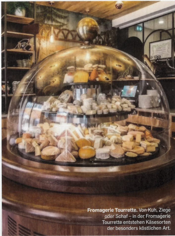
Fromagerie Tourrette. Von Kuh, Ziege oder Schaf – in der Fromagerie Tourrette entstehen Käsesorten der besonders köstlichen Art.